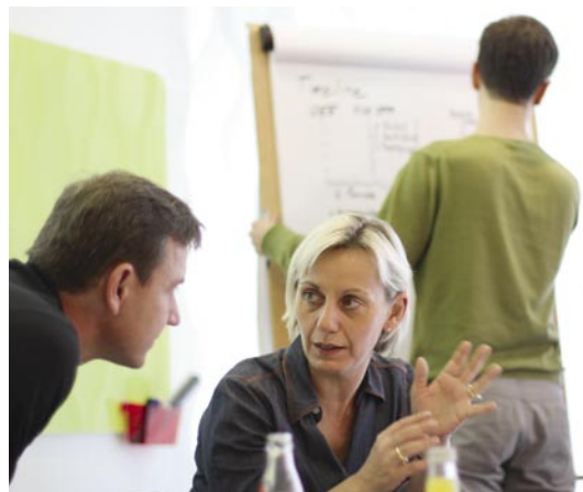
Projektarbeit ist fester Bestandteil des Curriculums.