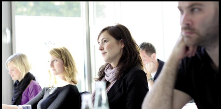
Kleine Kursgrößen sichern eine intensive Arbeitsatmosphäre