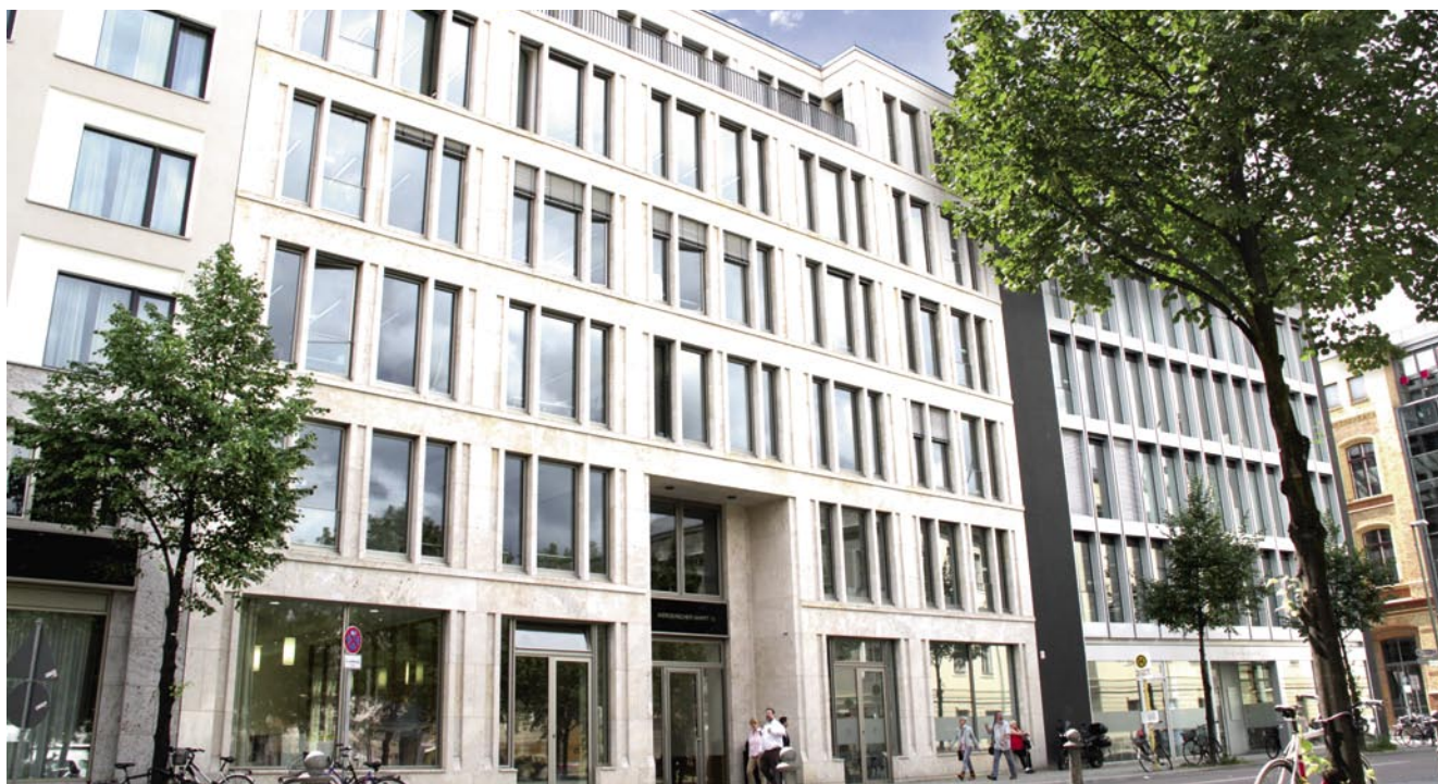
Der neue Standort der Quadriga Hochschule Berlin am Werderschen Markt

Die Studiengänge der Quadriga Hochschule Berlin sind durch die Zentrale Evaluations- und Akkreditierungsagentur Hannover (ZEVA) begutachtet und im Sommer 2011 mit dem besten Ergebnis „ohne Auflagen“ für fünf Jahre akkreditiert worden. Die Akkreditierung von Studiengängen dient dazu, die Qualität von Lehre und Studium zu sichern, Standards zu setzen und die internationale Vergleichbarkeit von Studienabschlüssen zu überwachen. Alle staatlichen und staatlich anerkannten privaten Hochschulen in Deutschland sind dazu verpflichtet, ihre Studienprogramme regelmäßig überprüfen zu lassen. Zu den externen Gutachtern zählen Wissenschaftler und Praktiker aus den Bereichen Wirtschaft, Kommunikation und Politik. Auf dem Prüfstand waren Studienkonzept, Ausbildungsziele, die Umsetzung rechtlicher Vorgaben, die internationale Vergleichbarkeit, die Studierbarkeit und Studienbetreuung sowie Prüfungen. Auch Personal, Ausstattungen und Wirtschaftsplan sowie das Qualitätsmanagement an der Hochschule wurden einer intensiven Prüfung unterzogen.